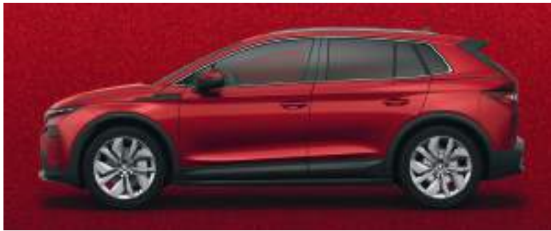
Kadife Kırmızı / Exclusive