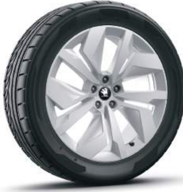
20" Vega Gümüş Metalik Alüminyum Alaşımlı Jantlar*