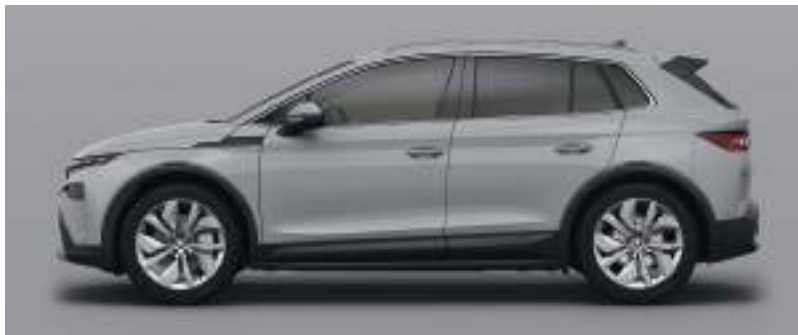
Çelik Gri / Özel