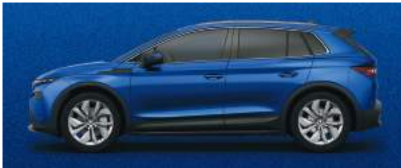
Yarış Mavisi / Metalik