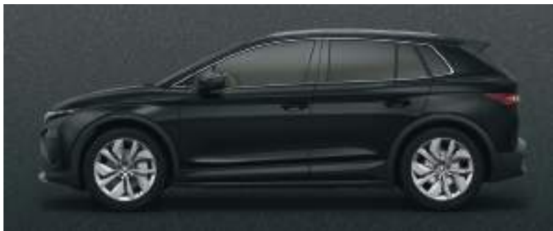
Büyüü Siyah / Metalik