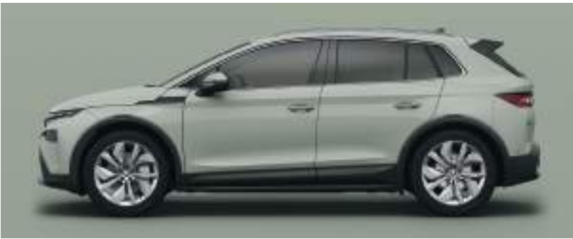
Timano Yeşil / Exclusive