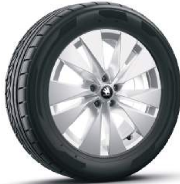
19" Proteus Gümüş Metalik Alüminyum Alaşımlı Jantlar