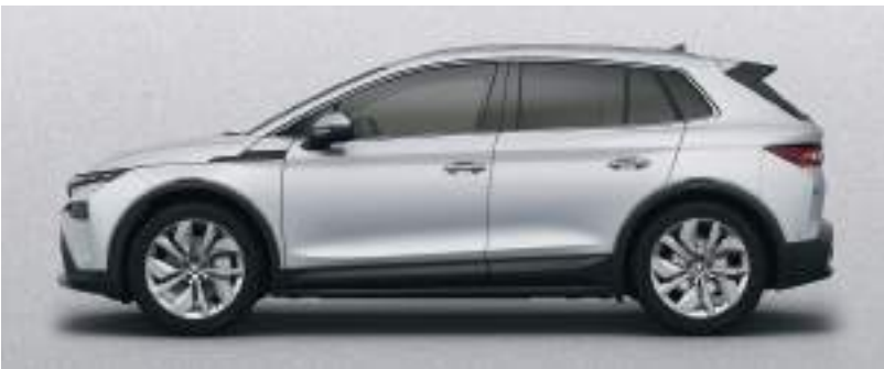
Gümüş / Metalik