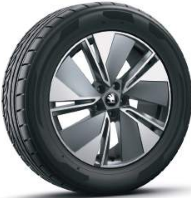
19" Regulus Antrasit Metalik Alüminyum Alaşımlı Aero Jantlar*