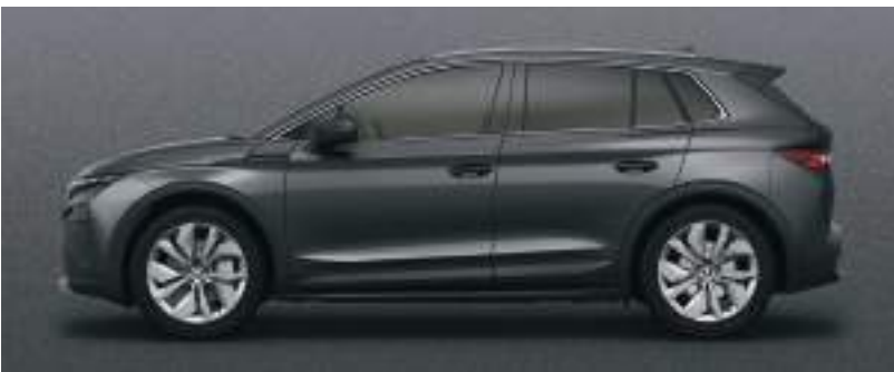
Graphite Gri / Metalik