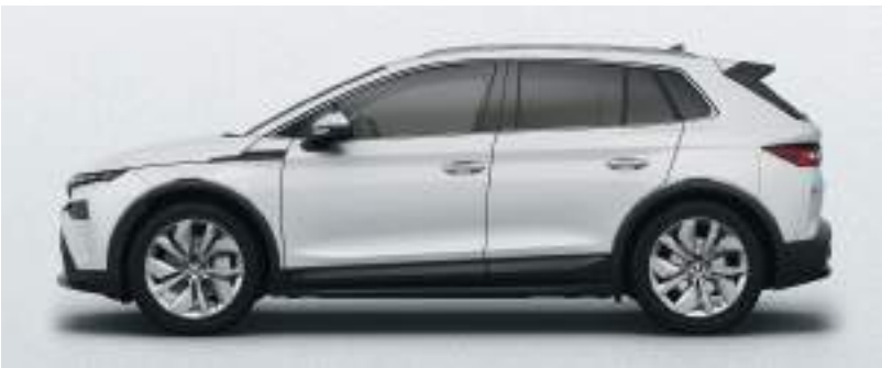
Ay Beyazı / Metalik